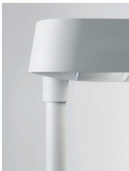
ECLAR R LED Stehleuchte (Detail Aufsteckbarer Leuchtenkopf) Design: Jörg Boner productdesign, 2014 Hersteller: Schätti Leuchten Dateiname: Pressefoto_ECLAR_06