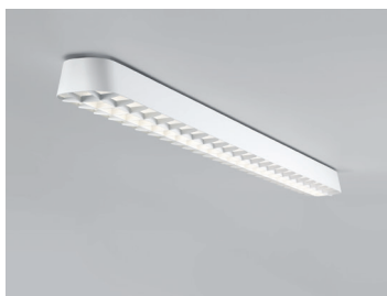
PENDAR C R LED Deckenleuchte 120 cm Design: Jörg Boner productdesign, 2014 Hersteller: Schätti Leuchten Dateiname: Pressefoto_PENDAR_04