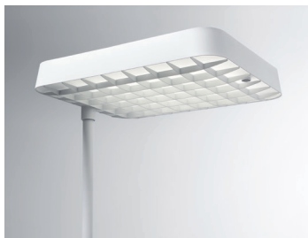
ECLAR LED Stehleuchte (Detail Leuchtenkopf mit Raster und Sensor) Design: Jörg Boner productdesign, 2014 Hersteller: Schätti Leuchten Dateiname: Pressefoto_ECLAR_02