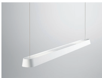
PENDAR R LED Pendelleuchte 120 cm Design: Jörg Boner productdesign, 2014 Hersteller: Schätti Leuchten Dateiname: Pressefoto_PENDAR_07