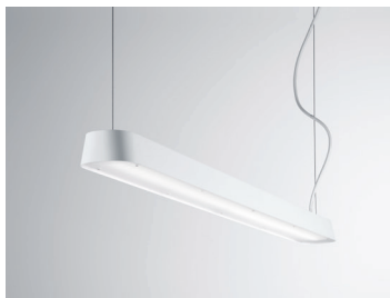
PENDAR P LED Pendelleuchte 120 cm Design: Jörg Boner productdesign, 2014 Hersteller: Schätti Leuchten Dateiname: Pressefoto_PENDAR_02