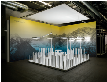
Messestand Design: Jörg Boner productdesign, 2016 Dateiname: Pressefoto_Messestand_01