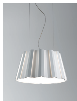
SIDAR P 60 Deckenleuchte Design: Jörg Boner & Christian Deuber 2009 Hersteller: Schätti Leuchten Dateiname: Pressefoto_SIDAR_01