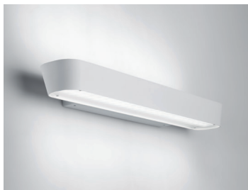
ANDAR LED 623 Wandleuchte Design: Jörg Boner productdesign, 2014 Hersteller: Schätti Leuchten Dateiname: Pressefoto_ANDAR_03