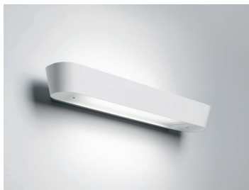
ANDAR LED 463 Wandleuchte Design: Jörg Boner productdesign, 2014 Hersteller: Schätti Leuchten Dateiname: Pressefoto_ANDAR_01