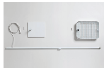
ECLAR R LED Stehleuchte (zerlegt in drei Bauteile, zwei Schrauben) Design: Jörg Boner productdesign, 2014 Hersteller: Schätti Leuchten Dateiname: Pressefoto_ECLAR_03