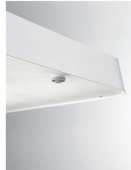
ECLAR LED Stehleuchte (Detail Strukturblende und Sensor) Design: Jörg Boner productdesign, 2014 Hersteller: Schätti Leuchten Dateiname: Pressefoto_ECLAR_04