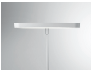
MAR Stehleuchte (Detail Leuchtenkopf) Design: Jörg Boner productdesign, 2016 Hersteller: Schätti Leuchten Dateiname: Pressefoto_MAR_02