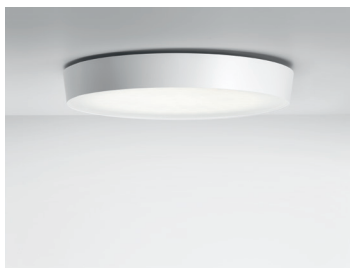
CIRCULAR C Deckenleuchte Design: Jörg Boner productdesign, 2016 Hersteller: Schätti Leuchten Dateiname: Pressefoto_CIRCULAR_04