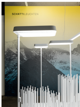
Messestand Design: Jörg Boner productdesign, 2016 Dateiname: Pressefoto_Messestand_05