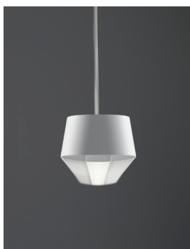
PENDAR P R LED Pendelleuchte Design: Jörg Boner productdesign, 2014 Hersteller: Schätti Leuchten Dateiname: Pressefoto_PENDAR_01

Fotograf der Leuchten: Felix Wey Die Bilder werden auf Anfrage von Schätti zur Verfügung gestellt