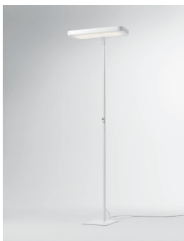
MAR Stehleuchte Design: Jörg Boner productdesign, 2016 Hersteller: Schätti Leuchten Dateiname: Pressefoto_MAR_01