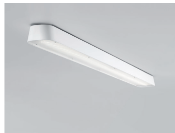
PENDAR C LED Deckenleuchte 120 cm Design: Jörg Boner productdesign, 2014 Hersteller: Schätti Leuchten Dateiname: Pressefoto_PENDAR_05