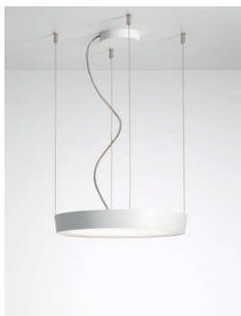
CIRCULAR P Pendelleuchte Design: Jörg Boner productdesign, 2016 Hersteller: Schätti Leuchten Dateiname: Pressefoto_CIRCULAR_03