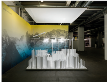
Messestand Design: Jörg Boner productdesign, 2016 Dateiname: Pressefoto_Messestand_02