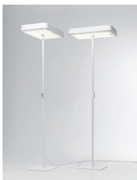
TABULAR LED S Stehleuchte Design: Jörg Boner productdesign, 2014 Hersteller: Schätti Leuchten Dateiname: Pressefoto_TABULAR_01