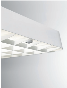
ECLAR R LED Stehleuchte (Detail Leuchtenkopf mit Raster und Sensor) Design: Jörg Boner productdesign, 2014 Hersteller: Schätti Leuchten Dateiname: Pressefoto_ECLAR_05