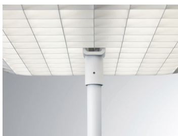
TABULAR LED S Stehleuchte (Detail Steckanschluss) Design: Jörg Boner productdesign, 2014 Hersteller: Schätti Leuchten Dateiname: Pressefoto_TABULAR_02