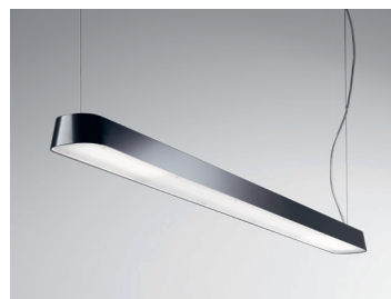
PENDAR P LED Pendelleuchte 150 cm (in Sonderfarbe) Design: Jörg Boner productdesign, 2014 Hersteller: Schätti Leuchten Dateiname: Pressefoto_PENDAR_06