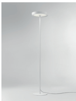
CIRCULAR F Stehleuchte Design: Jörg Boner productdesign, 2016 Hersteller: Schätti Leuchten Dateiname: Pressefoto_CIRCULAR_02