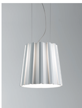
SIDAR P 45 Deckenleuchte Design: Jörg Boner & Christian Deuber 2009 Hersteller: Schätti Leuchten Dateiname: Pressefoto_SIDAR_03