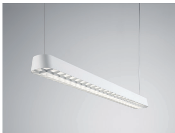
PENDAR P R LED Pendelleuchte 120 cm Design: Jörg Boner productdesign, 2014 Hersteller: Schätti Leuchten Dateiname: Pressefoto_PENDAR_03