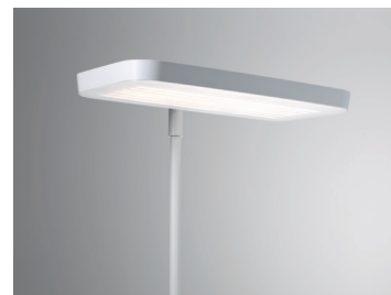
MAR Stehleuchte (Detail Leuchtenkopf) Design: Jörg Boner productdesign, 2016 Hersteller: Schätti Leuchten Dateiname: Pressefoto_MAR_03