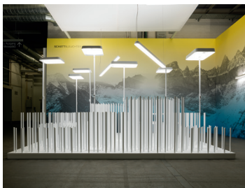
Messestand Design: Jörg Boner productdesign, 2016 Dateiname: Pressefoto_Messestand_04