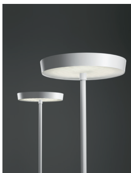
CIRCULAR F Stehleuchte Design: Jörg Boner productdesign, 2016 Hersteller: Schätti Leuchten Dateiname: Pressefoto_CIRCULAR_01