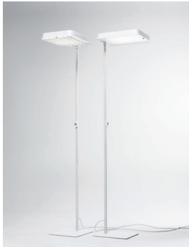
ECLAR R & ECLAR LED Stehleuchte Design: Jörg Boner productdesign, 2014 Hersteller: Schätti Leuchten Dateiname: Pressefoto_ECLAR_01