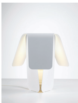
DRI Tischleuchte Design: Jörg Boner productdesign, 2009 Hersteller: Schätti Leuchten Dateiname: Pressefoto_DRI_01