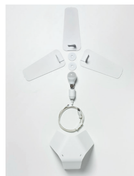
DRI Tischleuchte (Bauteile) Design: Jörg Boner productdesign, 2009 Hersteller: Schätti Leuchten Dateiname: Pressefoto_DRI_02

Fotograf der Leuchten: Felix Wey Die Bilder werden auf Anfrage von Schätti zur Verfügung gestellt